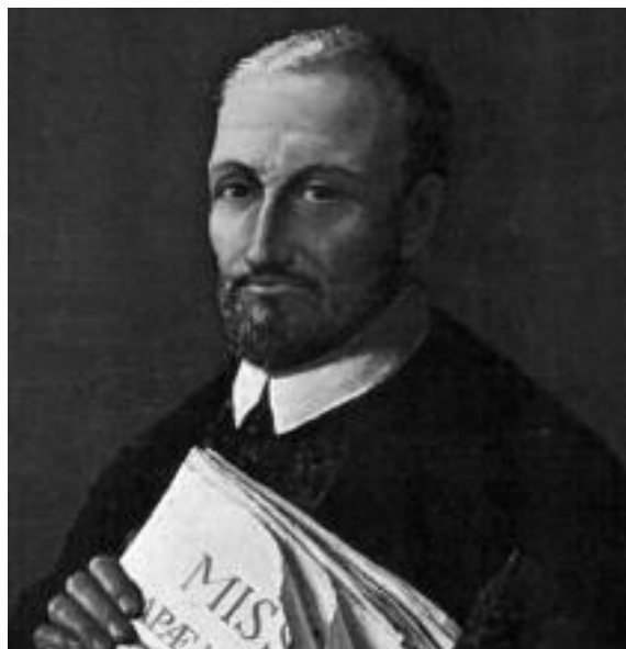
Giovanni Pierluigi da Palestrina

Spesso una lettura per immagini, troppo orientata verso la decifrazione della simbologia sonora di una composizione, ancorché dotata di un supporto verbale altamente referenziale qual è quello del Requiem , rischia di adombrare la percezione delle strutture musicali che procedono indipendentemente dal decorso