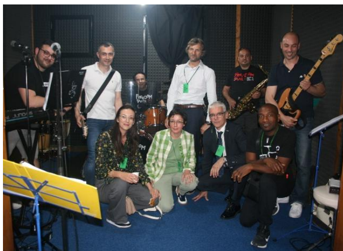
I MEMBRI DELLA BAND FREEDOM SOUND INSIEME AI REFERENTI DEL PROGETTO MUSICA IN CARCERE NELLA SALA MUSICA DEL SECONDA CASA DI RECLUSIONE MILANO-BOLLATE