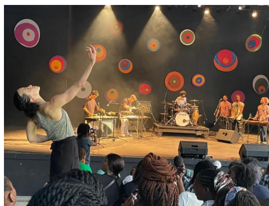
PERFORMANCE AL CENTRO FRANCO MOZAMBICANO DI MAPUTO, 21 GIUGNO 2025

A seguito della missione in Mozambico del giugno 2025, il 21 giugno, in occasione della Festa della Musica, si è tenuto presso il Centro Franco Mozambicano di Maputo uno spettacolo di musica e danza nato dallo scambio artistico tra musicisti e danzatrici francesi e mozambicani. Questa performance rappresenta la prima tappa di un progetto più ampio, attualmente in fase di sviluppo, dedicato alla musica e alla danza, che troverà accoglienza in Italia nell'ambito di una futura edizione del Festival Milano Musica.