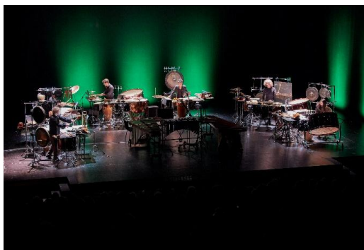
LES PERCUSSIONS DE STRASBOURG TEATRO ELFO PUCCINI 15 MAGGIO 2023