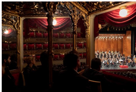
ORCHESTRA SINFONICA NAZIONALE DELLA RAI TEATRO ALLA SCALA 7 MAGGIO 2023