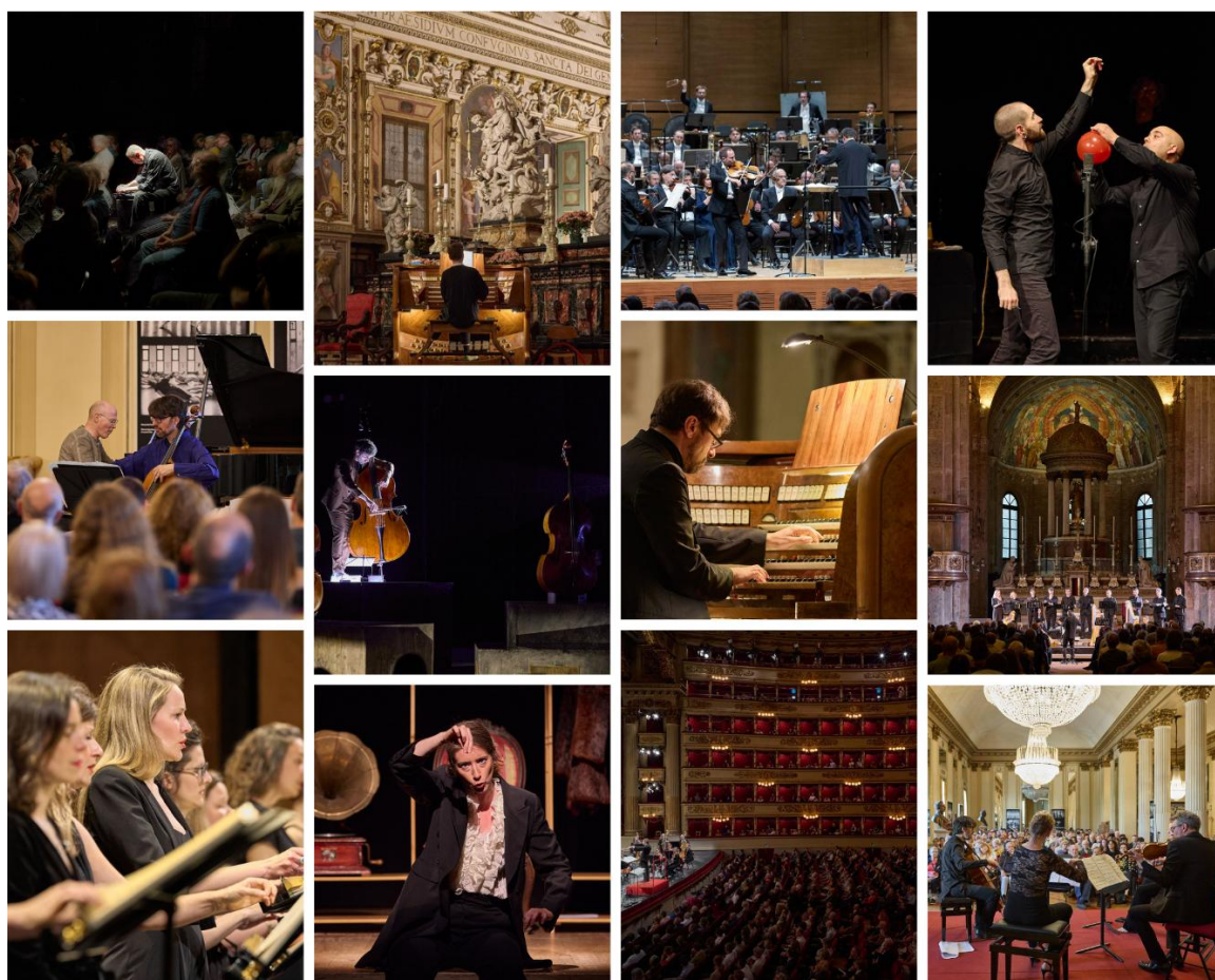
ALCUNI MOMENTI DEL 35° FESTIVAL MILANO MUSICA 2025 FRANCESCO FILIDEI. FIORI, TEMPO RESPIRO

Tra i vari momenti di incontro con il compositore, dal Conservatorio di Milano a Palazzo Invernizzi, la Giornata di Studi alla Biblioteca Braidense, curata da Ingrid Pustijanac , ha proposto spunti di riflessione sull'ampio catalogo presentato in questo festival: dal repertorio da camera ai brani per ensemble strumentale e vocale, dalle partiture grafiche per pianoforte del 1995-1996 al teatro musicale e ai più ampi lavori sinfonici degli anni recenti.