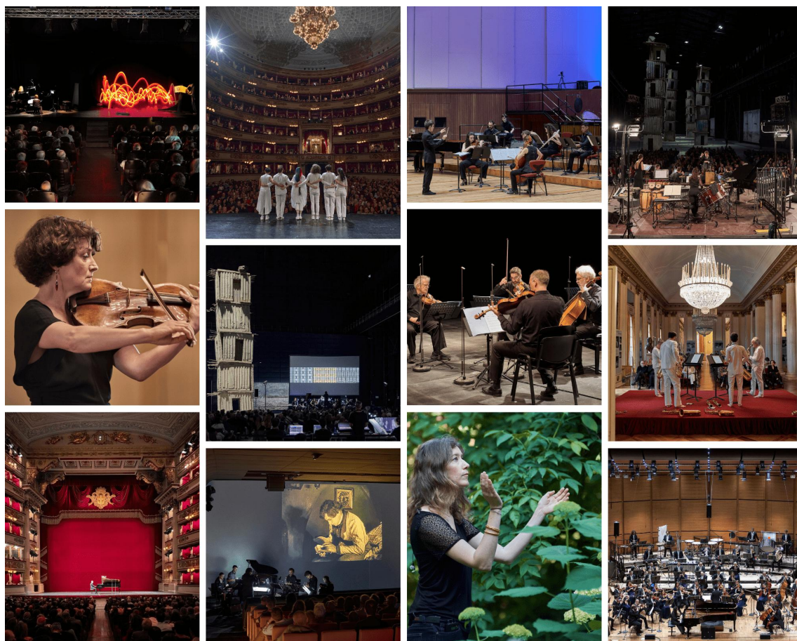
ALCUNI MOMENTI DEL 33° FESTIVAL MILANO MUSICA 2024 L'ASCOLTO INQUIETO

Ascolto inquieto , perché in dialogo con il mondo, con la volontà di portare la musica del Festival in luoghi inattesi, a creare nuovi spazi di ascolto per un nuovo pubblico: all'Orto Botanico di Brera l'Eloge de la plante , performance per voce ed elettronica di Jean-Luc Hervé , protagonista il soprano Jeanne Crousaud , è sconfinato in immaginari poetici e sonori vegetali; alla Sala Donatoni della Fabbrica del Vapore , con i concerti partecipati per ragazzi a cura di Daniel Kollé , percussionista e didatta, e la presentazione di nuovi studi per una rappresentazione acustica della città , in collaborazione con il Liceo Statale Musicale Carlo Tenca, i cui studenti hanno composto lavori di musica elettronica, liberamente ispirati a Ritratto di città . Studio per una rappresentazione radiofonica di Bruno Maderna e Luciano Berio