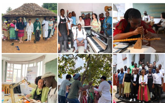
FOTO DALLA MISSIONE A MAPUTO DI GIUGNO 2024

Promuovere la creazione di ecosistemi in grado di stimolare la nascita di nuove imprese, l'innovazione e la crescita di quelle esistenti nel settore delle industrie culturali e creative. Accompagnare il rilancio delle storiche case della cultura e la loro trasformazione in