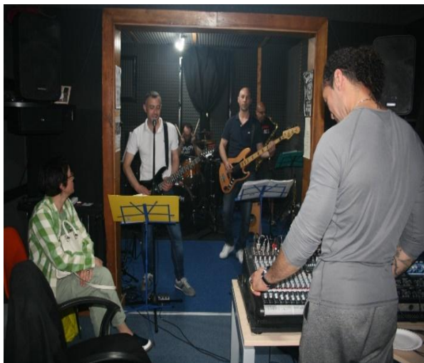
PROVE MUSICALI PRESSO LA SALA MUSICA DEL SECONDA CASA DI RECLUSIONE MILANO-BOLLATE

Introduzione di nuovi strumenti musicali (donazione di due chitarre e un pianoforte digitale Yamaha) e distribuzione del materiale didattico necessario per le lezioni di musica, con inaugurazione il 7 giugno 2023 (ore 18).