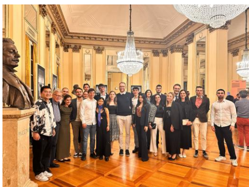
GLI STUDENTI DEL POLITECNICO DI MILANO AL TEATRO ALLA SCALA IN OCCASIONE DEL CONCERTO DEL 2 MAGGIO 2025

Il maestro Califano è stato capace di catturare l'attenzione dei ragazzi e di guidarli in percorso di riflessione e approfondimento che non si esaurirà con la partecipazione al concerto dell'HangarBicocca, ma li accompagnerà anche in futuro. I ragazzi si sono sentiti coinvolti in prima persona e sono stati molto contenti di aver avuto la possibilità di dialogare col maestro.