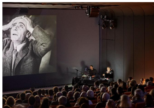
EDISON STUDIO, MEET 11 MAGGIO 2023

Gli appuntamenti in collaborazione con MEET Digital Culture Center hanno legato passato e futuri, con la proiezione di Metropolis di Fritz Lang, capolavoro del cinema muto con la nuova colonna sonora performativa elettroacustica del collettivo Edison Studio in prima assoluta, in collaborazione con Ravenna Festival, e con la performance elettroacustica del ciclo della Trilogia dei folletti di Cacciatore con Syntax Ensemble, artist-in residence 2023-2024.