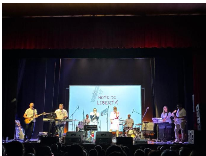
LA BAND FREEDOM SOUNDS DURANTE IL CONCERTO NOTE DI LIBERTÀ AL TEATRO MARTINITT, 10 NOVEMBRE 2025

2 dicembre 2025 – Comunità Shalom di Palazzolo s/Oglio (BS)